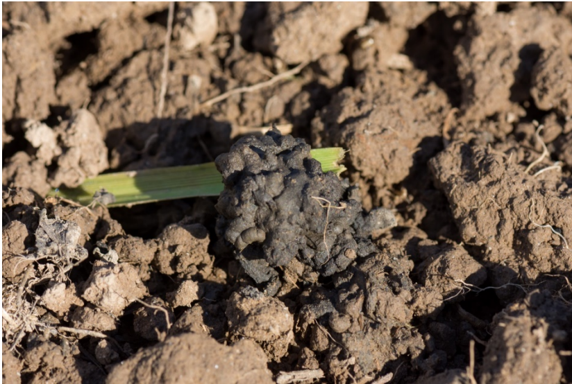
Abb. 3. Vertikal grabende Regenwürmer verfrachten den aufgenommenen PK-Mist mit ihren Ausscheidungen in tiefere Bodenschichten.

Durch die Nutzung der PK in der Tierhaltung gelangt die PK entweder über den Mist oder über die Gülle ins Feld (Kammann et al. , 2017, Quicker und Weber, 2016). Wird die Gülle mittels Schleppllauch und Einschlitzverfahren in den Boden eingetragen, gelangt auch die PK in die Zone, wo sie agronomisch am wertvollsten ist. Wird die PK-Gülle z.B. mittels traditionellem Prallteller ausgebracht, verbleibt die nährstoffbeladene PK an der Oberfläche und wird nur langsam über die Aktivität von Bodenlebewesen in den Boden eingetragen; je biologisch aktiver und bewachsener der Boden ist, desto schneller erfolgt der Transport in tiefere Bodenschichten. Gleiches gilt bei der üblichen Ausbringung von gelagertem oder kompostiertem Mist mittels Miststreuer, sofern wie auf Weiden keine Bodenbearbeitung folgt. Kompostierter PK-Mist wird allerdings schneller zersetzt als Gülle oder Biogasgülle und wird biologisch eingearbeitet (Abb. 3).